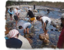
気分は石原裕次郎